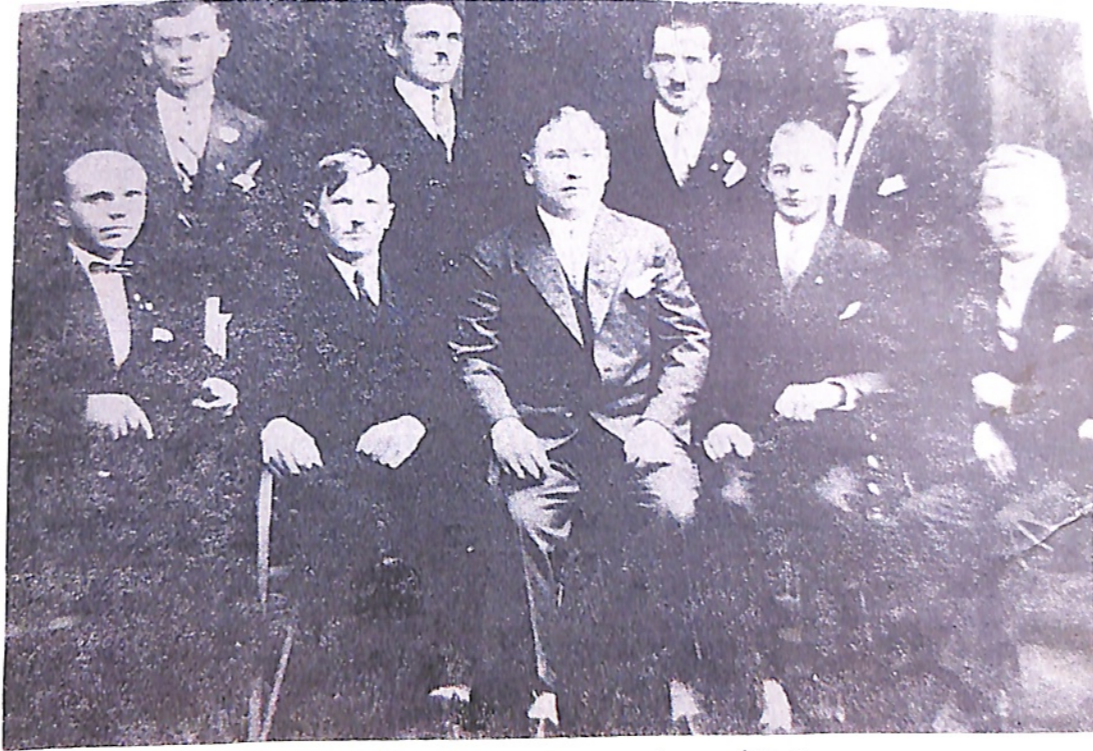
Zarząd Klubu w roku 1928

Że sportu: W najbliższym, niedziewię ostrowsko publiczności sportowej będzie świątkiem niecodziennej imprezy sportowej, która napewno zelektryzuje prawie całe miasto. Spotkają się bowiem dwie drużyny, które od początku swego istnienia rywalizowały ze sobą i wal-