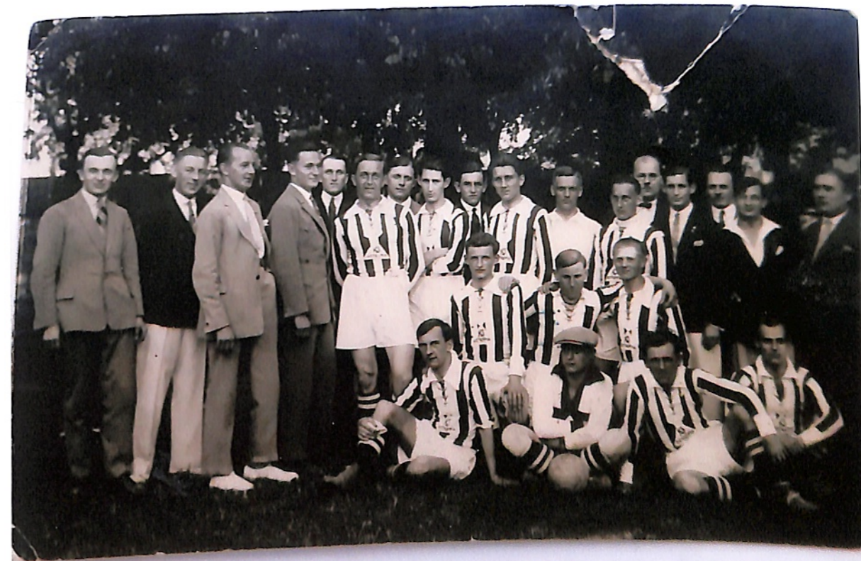
Pracze Klubu Sportowego „Ostrovia” 1928 rok. (Zdjęcie podpisane).

40-lecie kaliski Okręgowy Związek Piłki Nożnej - 2016