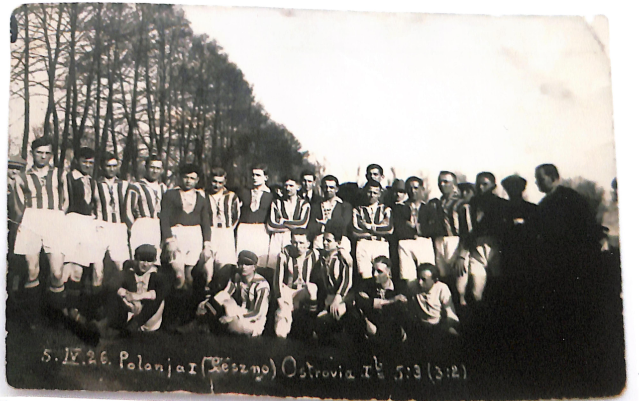
5. IV. 26. Polonia (Leszno) Ostrovia 1 o 5:3 (3:2) Polonia Leszno - Ostrovia 5:3 (3:2)

Ilustrowany Kurjer Sportowy: dodatek do piątdzielnego numeru Nowego Kurjera Polskiego 1926, Nr 3 wydano w Warszawie