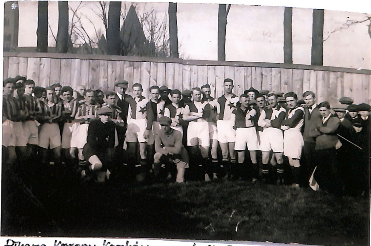
Atkome Korony Kraków oraz k. S. „Ostrovia” w I pojedynku nasza drużyna wygrała 4:0, a II pojedynku padł remis 1:1. Mecz odbył się za kościołem faryjnym, boisko na ogródkach proboszczowskich.

O godz. Union I. - Ostrovia I. Łódź. Ostrów.