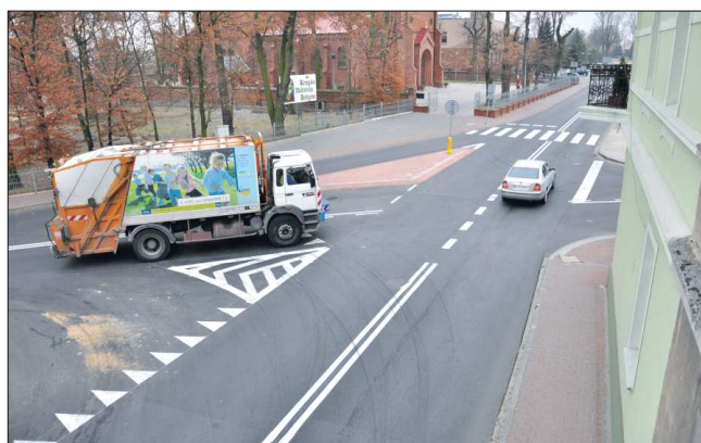
Skrzyżowanie przy ul. Ostrowskiej