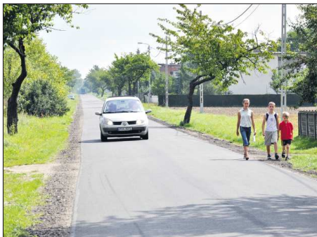
Droga w Moszczance

Zakończyła się budowa drogi w Rąbczynie, która w całości sfinansowana jest przez budżet gminny. Mieszkańcy Przybysławic mogą cieszyć się z nowego dywanika asfaltowego, który został położony na drodze przy parku. W trakcie realizacji jest budowa drogi asfaltowej w Jaskółkach (tzw. Zapłocie). W samym Raszkowie położony został chodnik przy ulicy Kaliskiej oraz na odcinku ulicy Orpiszewskiej -