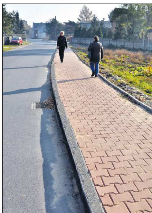
Chodnik przy ul. Orpiszewskiej

od Ostrowskiej do Piaskowej. Ponadto gmina angażowała się w prace, które są prowadzone na naszym terenie przez Powiat Ostrowski. Zakończyła się już modernizacja drogi do Szczurawic w miejscowości Moszczanka oraz budowa drogi Grudzielcu. Dofinansowanie tych inwestycji z gminnego budżetu wyniosło 300tys. zł. Swój wkład finansowy mamy również przy położeniu chodnika na trasie Raszków - Pogrzybów oraz w miejscowościach: Sulisław i Janków Załęśny. Wszystko to ma na celu podwyższenie komfortu i bezpieczeństwa na drogach mieszkańców gminy.