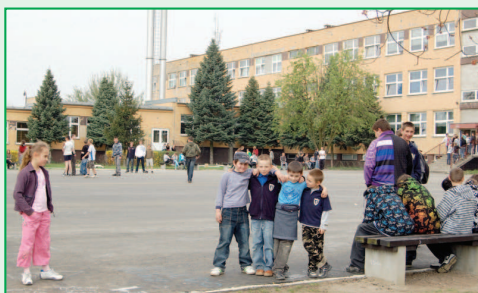
Wyremontowane boisko asfaltowe przy szkole w Raszowie

W dniu 30 marca 2009 roku do Urzędu Marszałkowskiego został złożony wniosek o dofinansowanie zadania „Zagospodarowanie centrum wsi Przybysławice i odnowa Parku”. Na powyższe zadanie zostały zabezpieczone środki w wysokości 550 tys. zł, a zadanie polega m. in. na wybudowaniu odcinka chodnika od strony Pogrzybowa do parku, odbudowie stawów, budowie mostków oraz odnowieniu nawierzchni alejki parkowej. Największe środki finansowe w planie zadań majątkowych stanowią inwestycje drogowe. W tegorocznym budżecie na ten cel prze-