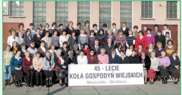
45-lecie Kół Gospodyń Wiejskich Moszczanka-Skrzebowa

Od dwóch lat reaktywują się kolejne Kola Gospodyń Wiejskich. Panie będące członkiniami KGW wracają do starych tradycji wspólnych spotkań i organizowania życia na wsi.