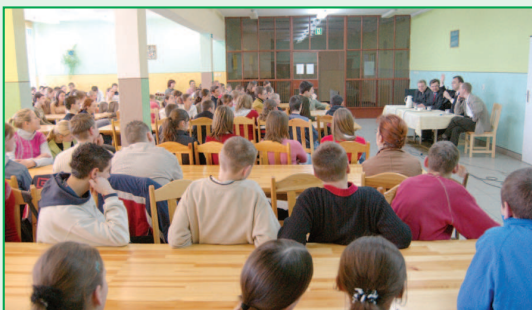
Spotkanie z młodzieżą w raszkowskim gimnazjum