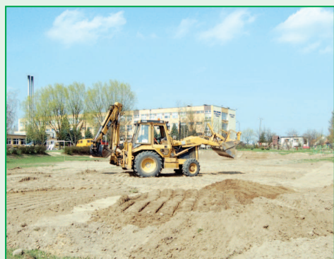
Budowa nowego boiska z programu „Blisko Boisko”

znaczone ponad 1,7 mln zł. Na ostatniej sesji radni podjęli trzy uchwały w sprawie udzielenia pomocy finansowej na realizację zadań inwestycyjnych w ramach „Powiatowo – gminnego programu współfinansowania zadań drogowych na drogach powiatowych”. Na mocy podjętych uchwał z budżetu Gminy i Miasta Raszów zostanie przekazana Powiatowi Ostrowskiemu pomoc finansowa na realizację zadań inwestycyjnych na drogach powiatowych. Największą inwestycją realizowaną wspólnie z powiatem będzie przebudowa drogi w Szczurawicach na odcinku około 1100 m. Koszt inwestycji powinien się zamknąć w kwocie 360 tys. zł, a pomoc z budżetu gminy wyniesie 180 tys. zł. Kolejnymi inwestycjami realizowanymi wspólnie z powiatem ostrowskim będzie budowa chodnika z odwodnie-