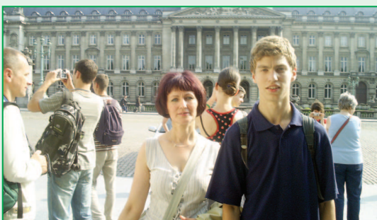
Mieszkańcy gminy Raszków w Brukseli